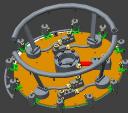
Sprühkopf für Eisenbahnräder